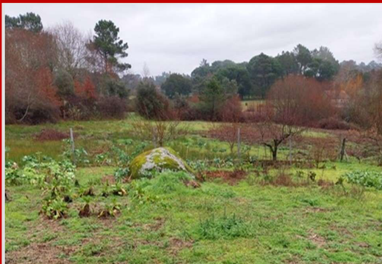
Verba 1 – 1/3 prédio rústico 450 m 2 - Valor mínimo de venda: 637,50 €