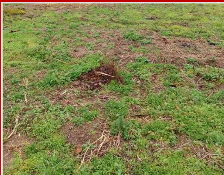
Verba 3 – 1/3 prédio rústico 627 m 2 - Valor mínimo de venda: 888,25 €