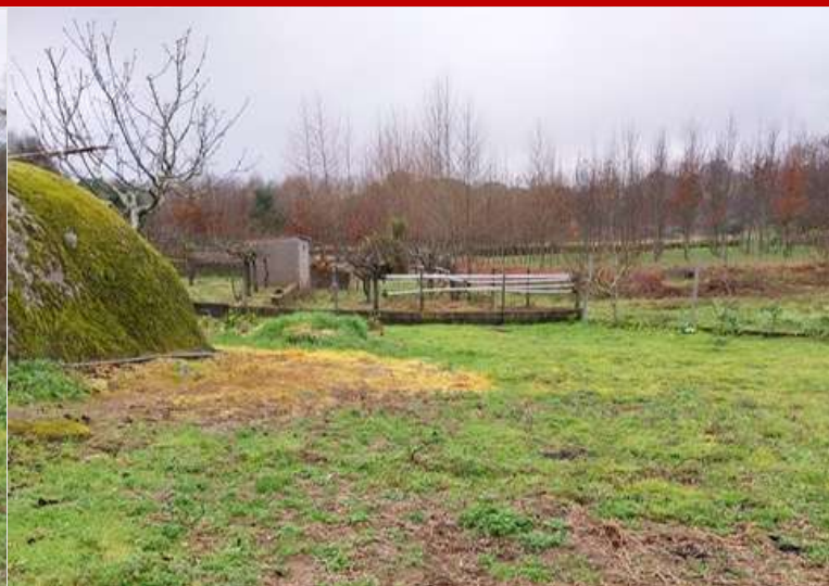
Verba 2 – 1/3 prédio rústico 900 m 2 - Valor mínimo de venda: 1.275,00 €